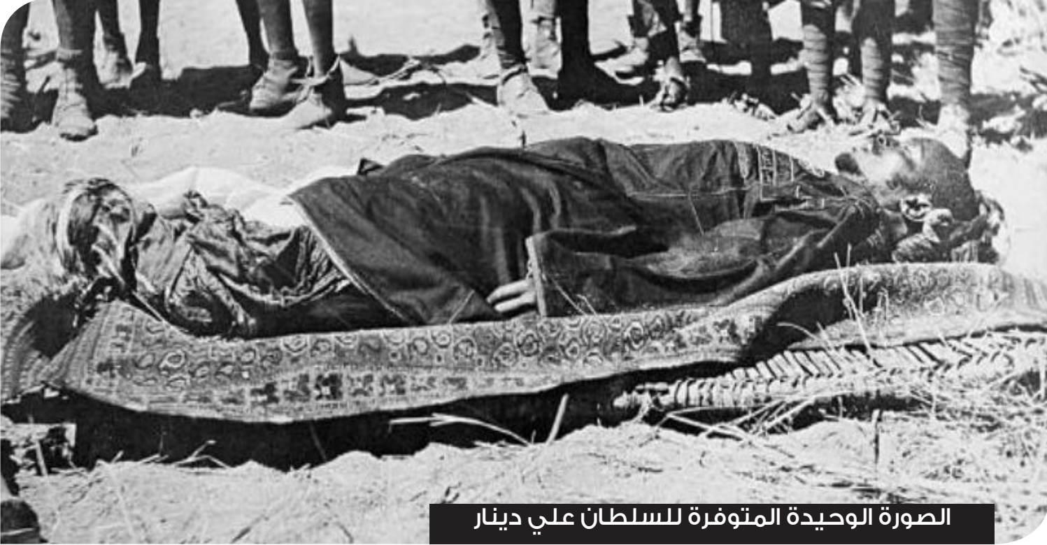
الصورة الوحيدة المتوفرة للسلطان علي دينار

الحكومة الانجليزية لعدم استطاعة دارفور الصمود طويلاً أمام العناد العسكري للجيش البريطاني المجهز بأحدث الأجهزة ولكن السلطان كان عنيداً واختلف معهم في الرأي وبدأ في معاداة اهله واندفع الغرباء اليه الأغرأب اللذين ظاهروا موالاته بينما اخفوا عنه حقيقة موالاتهم للإنجليز السرية. تمكنت السلطة البريطانية من الدخول الي الفاشر واللاحق به في طريقة الي جبل مرة بواسطة الجواسيس الذين كانوا له بالمرصاد وابلغوا القائد كتشتر بمكانه بالفعل تم للعملاء ما ارادوا فعند فجر يوم من اواخر ايام اغسطس ١٩١٦ تقدم السلطان ليؤم المصلين في صلاة الفجر فباغته جنود المستعمر وعملائه وامطروا عليه وابل من الرصاص فسقط شهيداً علي سجادة الصلاة فتمكنت السلطة الاستعمارية بعد موته من ضم اقليم دارفور الي دائرة الحكم البريطاني . وبذلك تكون قد انتهت سلطنة الفور وهو آخر سلاطينها وهو السلطان علي دينار وله من الابناء الذكور ٥٢ ومن الاناث ٤٧ بنت. وبذلك تكون قد انتهت حياة السلطان.